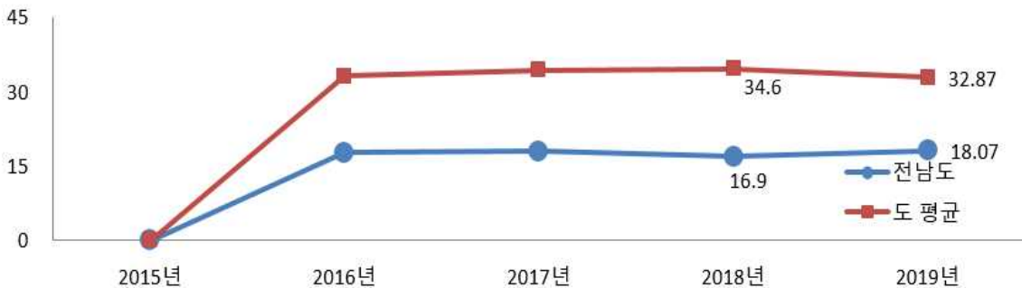
유사 지방자치단체와 재정자립도 비교

우리 도는 자체예산보다 이전재원 비중이 높은편으로 재정자립도가 9개 도 평균보다 14.8% 낮으나, 적극 재정보호 노력 등으로 작년대비 1.2% 소폭 상향됨