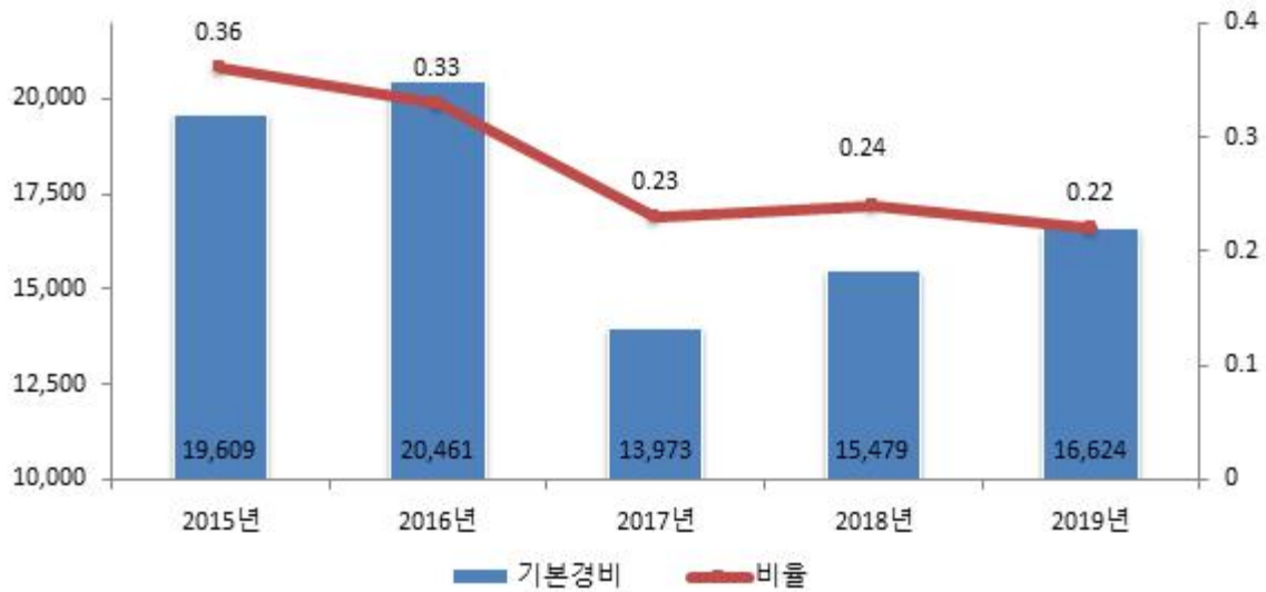
기본경비 연도별 변화

☞ 우리 도 기본경비는 작년보다 세출 결산액 대비 0.02% 감소하였고 세출구조조정 등으로 인한 기본경비 절감 시행으로 그 비율은 점차 낮아지고 있는 추세입니다.